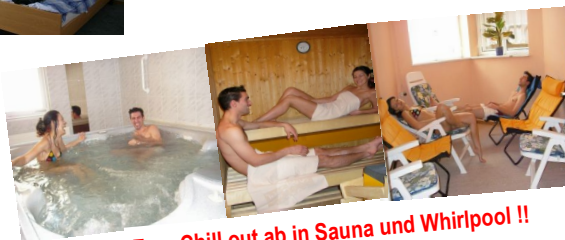
Zum Chill out ab in Sauna und Whirlpool !!

Komfort: Doppelzimmer 19 qm, und Dreibett und Vierbett Familienzimmer 23-26 qm, alle mit DU oder Bad/WC, Digitales Sat.TV, Weckradio und Sitzecke meist Südbalkon und teils Free WLAN Benützung von Sauna und Whirlpool bereits inklusive.